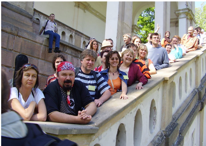
Účastníci 2. Jičinského poetického jara v roce 2007.