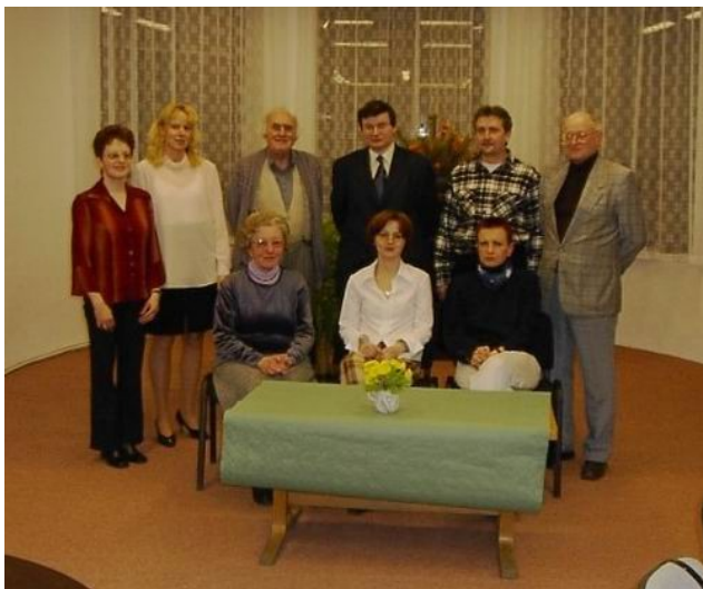
Snímek z akce LISU 21.března 2003 v Městské knihovně v Jičíně.