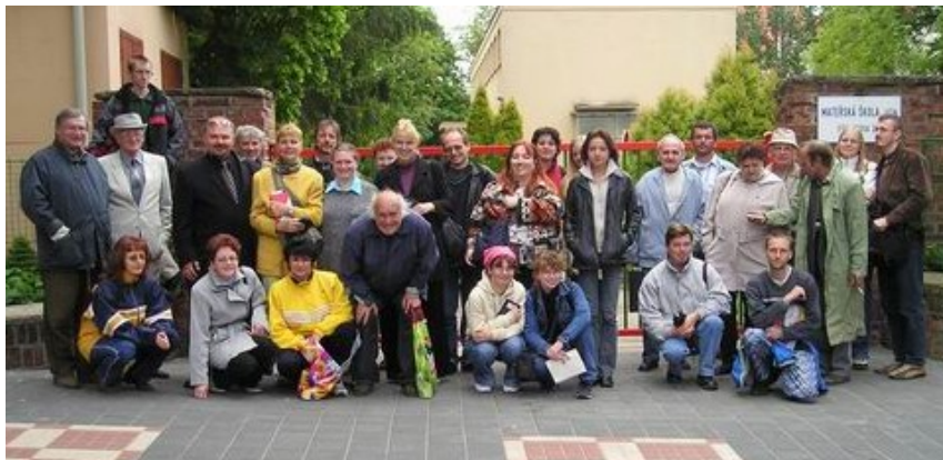
Účastníci Jičínského poetického jara 2004.