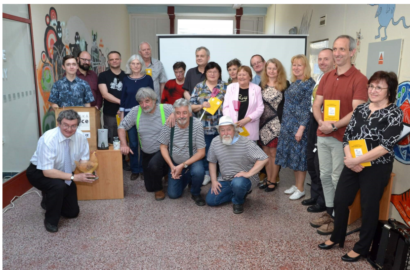
Účastníci Řehečské slepice 2024.